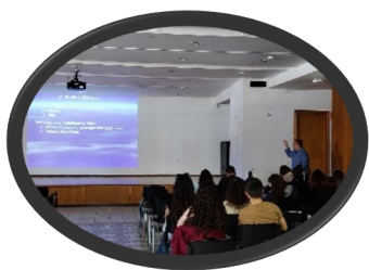
Difusión entre los estudiantes universitarios