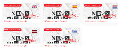
Un curso sobre noticias falsas está disponible en cinco idiomas.